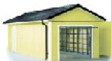
5. Monter tagrender, tag- og facadebeklædning samt port