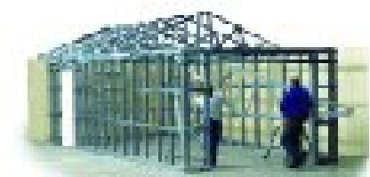
4. Monter sektionerne