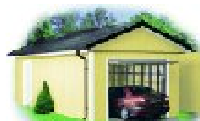
6. Færdigt arbejde